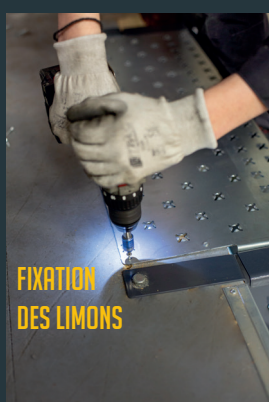
FIXATION DES LIMONS