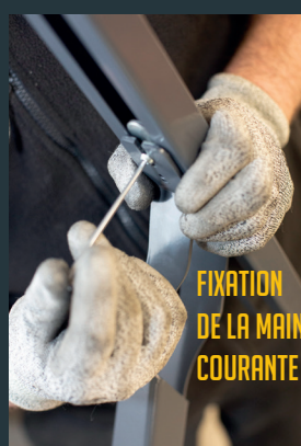
FIXATION DE LA MAIN COURANTE