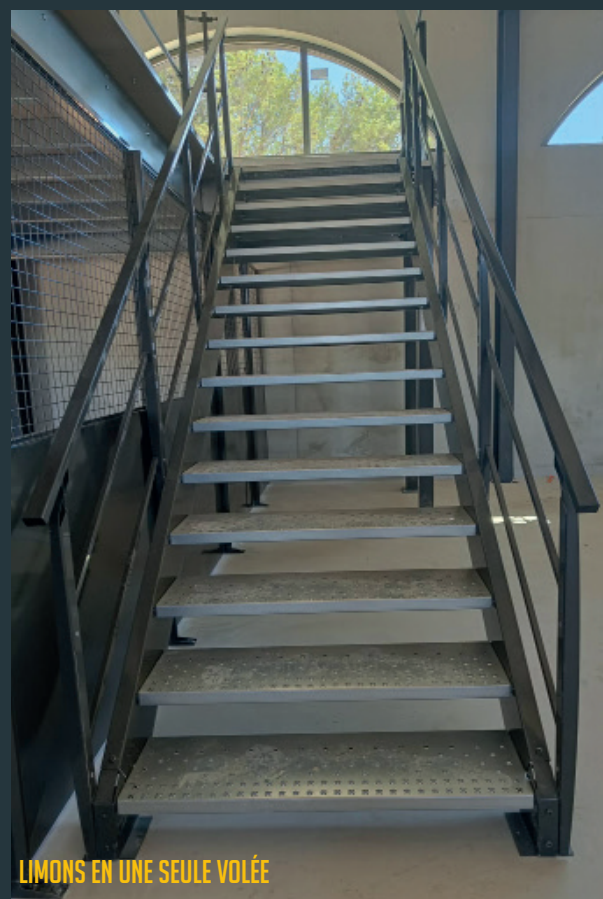
LIMONS EN UNE SEULE VOLÉE