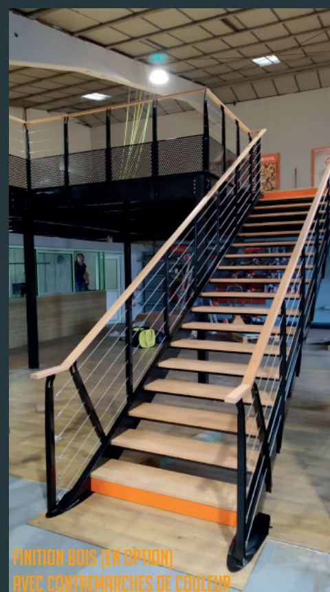
FINITION BOIS (EN OPTION) AVEC CONTREMARCHES DE COULEUR