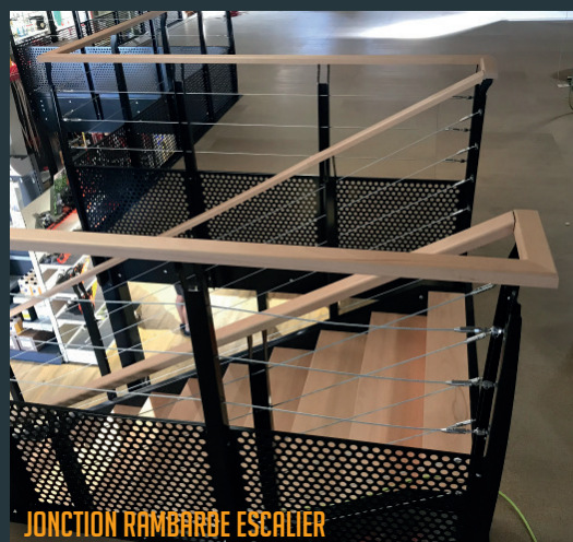
JONCTION RAMBARDE ESCALIER